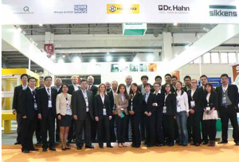
Команда VBH в Пекине и представители фирм, которые совместно с VBH воплощают в жизнь инициативу „Почувствуйте разницу“ на фоне стенда VBH.

По всей вероятности, правительству придется скоро смягчить эти ограничения, поскольку снижение цен может приостановить экономический рост. Согласно отчету Народного Университета Китая, цены на недвижимость, объемы покупок и инвестиции в первом квартале следующего года должны сократиться из-за политики штрафов и централизованного регулирования.