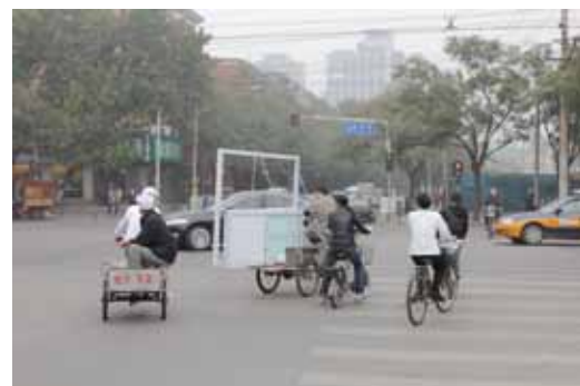
Вверху: монтаж окон в центре Пекина. Внизу: транспортное средство. Но все же первое впечатление обманчиво: Китай не остановился в Средневековье, он одновременно старомоден и современен.

первого взноса, ограничение количества собственных квартир на человека, введение налога на недвижимость и строительство социального жилья.