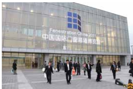
Впечатления от стенда

первого взноса, ограничение количества собственных квартир на человека, введение налога на недвижимость и строительство социального жилья.