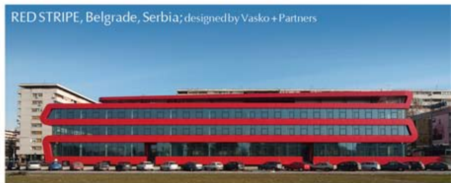
RED STRIPE, Belgrade, Serbia; designed by Vasko + Partners