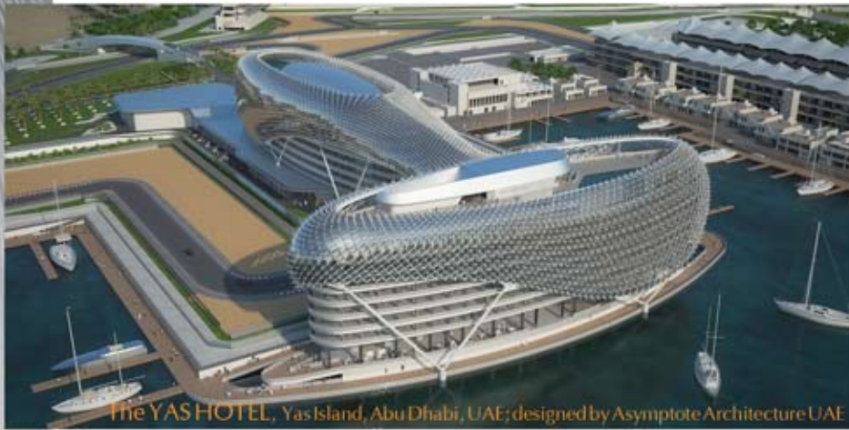
The YASHOTEL, Yas Island, Abu Dhabi, UAE; designed by Asymptote Architecture UAE