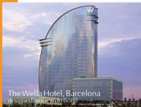
The Wella Hotel, Barcelona designed by Ricardo Bofill