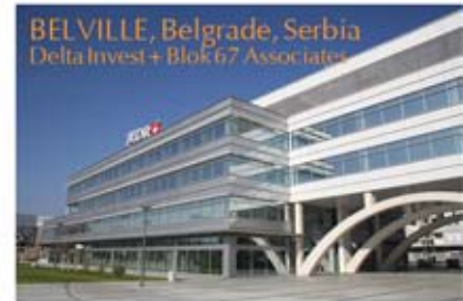
BELVILLE, Belgrade, Serbia Delta Invest + Blok 67 Associates