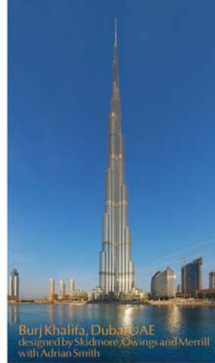
Burj Khalifa, Dubai, UAE designed by Skidmore, Owings and Merrill with Adrian Smith