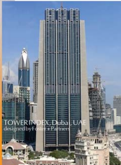
TOWER INDEX, Dubai, UAE designed by Foster + Partners