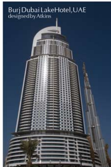
Burj Dubai Lake Hotel, UAE designed by Atkins